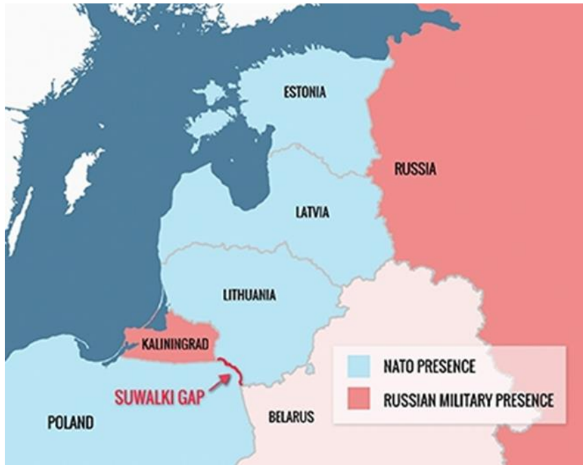
Baltıklarda Nato-Rusya Nüfuz Bölgeleri Haritası (Turkuaz: Nato Nüfuz Alanı, Pembe: Rus Nüfuz Alanı)

hava üssü, hava savunma sistemleri, deniz üssü ve nükleer deniz altı sistemleri yerleştirmiş durumdadır. RF bu bölgeye sadece Baltık denizi vasıtasıyla ulaşabilmektedir. RF hem Kaliningrad'ı korumak hem de Baltık denizindeki jeopolitik çıkarlarını muhafaza etmek maksadıyla bölgede ABD tarafından yapılan stratejik girişimlere karşı çıkabilir. RF'yi Kaliningrad bölgesine karadan en kısa sürede ulaştıracak yol Beyaz Rusya ve Polonya ( Suwalki Koridoru) üzerinden geçmektedir. Beyaz Rusya Moskova'nın müttefikidir. Fakat bir çatışma durumunda Suwalki koridorunun kullanılması Polonya'yı da çatışmanın içerisine çekecek ve çatışmanın yayılmasına sebep olacaktır.