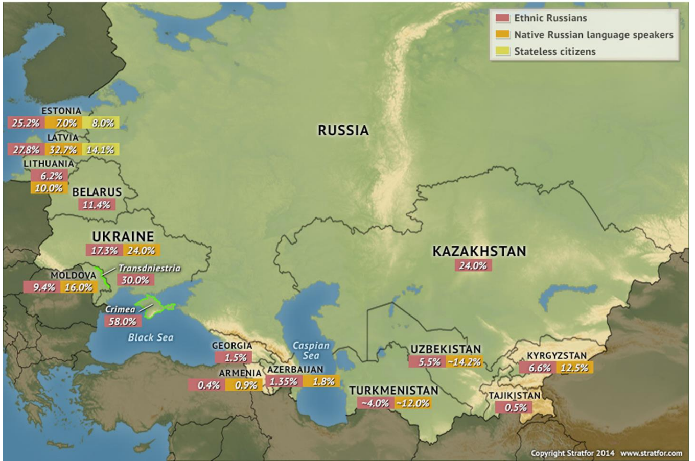
Rus Etnik Haritası (pembe: etnik rus nüfusu, turuncu: rusça anadil nüfus, sarı: vatansız vatandaşlar)

Bu durum Ukrayna için de geçerlidir. Ukrayna sahip olduğu coğrafi konumu, etnik çeşitliliği ve kaynakları ile jeopolitik bir mihverdir. Ukrayna doğu ile batı, RF ile Avrupa arasında bölünmüş bir sınır ülkesi (borderland) durumunda bulunmaktadır. 2004 yılında yaşanan Turuncu Devrim, RF ile 2006, 2009 ve 2013 yıllarında yaşanan enerji krizi Ukrayna'nın durumunu hassaslaştırmıştır. Ukrayna AB ve NATO üyeliği kapsamında batıya yaklaştıkça Moskova'nın tepkisini çekmiştir. Bu durum RF'nin 2014 yılında Kırım'ı ilhakı ile sonuçlanmıştır. Ukrayna'da Rus ve Rusça konuşan Ukraynalıların yaşadığı bölgelerde Kiev yönetimi kontrolü sağlayamamakta ve Moskova bu bölgelerde (Luhansk ve Donetsk) de facto bağımsız devletler kurmuş durumdadır. Ukrayna, Kırım ve Moldova'daki gelişmeler doğrudan Karadeniz'in güvenliğini de etkilemektedir. Aşağıdaki harita dikkatlice incelendiğinde gelecek dönemde Ukrayna konusunun uluslararası güvenliğin ana temalarından biri olacağını değerlendirmekteyiz. Ukrayna konusu Gürcistan'da yaşanan gelişmeler (Abhazya, Güney Osetya ve Acaristan) ile birlikte ele alındığında ve ABD'nin de Bulgaristan ve Romanya üzerinden bölgeye yerleşmeye çalıştığını düşündüğümüzde Karadeniz bölgesinin jeostratejik değerinin daha da artacağını değerlendirmekteyiz. Mavi Akım ve Türk Akımı gibi projeler ile Karadeniz deniz ulaşımının güvenliğini sağlanması