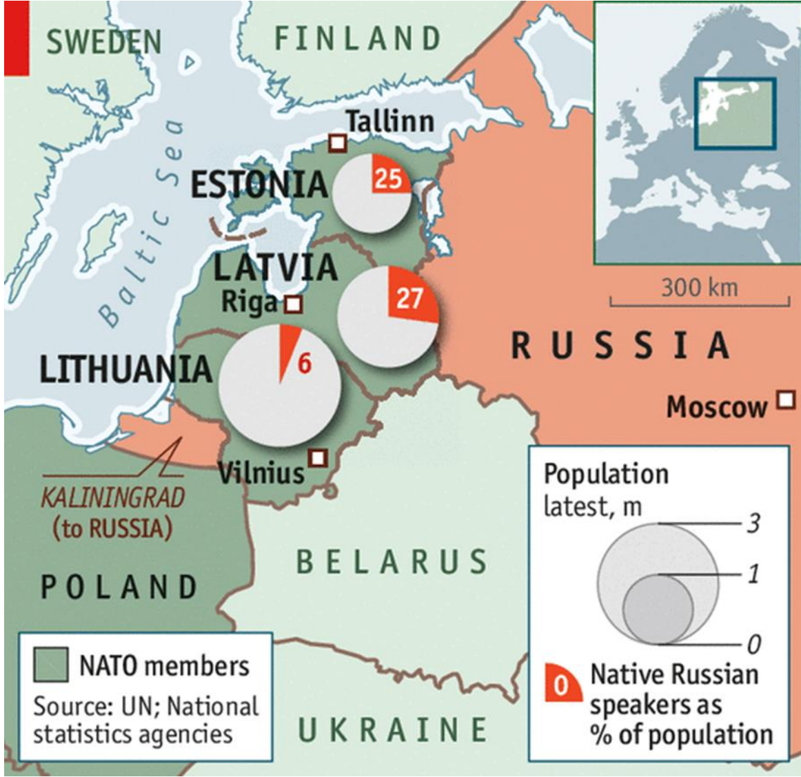
Nato Üyesi Baltık Ülkelerinde Rus Nüfusu Haritası (Estonya, Letonya, Litvanya, Polonya)

Baltık bölgesindeki bu istikrarsızlık en çok Almanya'yı rahatsız etmektedir. Almanya ihtiyacı olan doğalgazın %35'ini, petrolün %36'sını RF'den temin etmektedir. Almanya ile RF arasındaki ticaret hacmi 77 milyar dolardır. Alman sanayisini besleyen Rus doğalgazı Kuzey Akım hattı (Nord Stream) ile Almanya'ya ulaşmaktadır. Kuzey Akım Baltık denizinden geçmekte ve 2011 yılından buyana çalışmaktadır. Bu hatta paralel olarak inşa edilen Kuzey Akım-2 doğalgaz boru hattının ise 2019 yılı sonunda faaliyete geçmesi planlanmaktadır. Baltık bölgesinde yaşanacak istikrarsızlık doğrudan enerji güvenliğini ve ona bağlı olarak da ekonomik güvenliğini etkileyecektir. Kısacası Almanya ile RF arasındaki ilişkiler her iki taraf için de stratejik niteliklidir. Nitekim ünlü stratejist Brezezinski Alman teknolojiyi ile Rus kaynaklarının bir araya gelmesine sebep olacak işbirliğinin Amerika'nın Avrasya çıkarlarına aykırı olduğunu vurgulamaktadır. Bize göre Almanya ile RF arasındaki ittifakın gelecekte alacağı şekil Avrasya jeopolitiğinin şekillenmesinde belirleyici olacaktır.