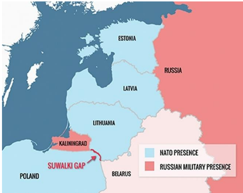
Baltıklarda Nato-Rusya Nüfuz Bölgeleri Haritası (Turkuaz: Nato Nüfuz Alanı, Pembe: Rus Nüfuz Alanı)

hava üssü, hava savunma sistemleri, deniz üssü ve nükleer deniz altı sistemleri yerleştirmiş durumdadır. RF bu bölgeye sadece Baltık denizi vasıtasıyla ulaşabilmektedir. RF hem Kaliningrad'ı korumak hem de Baltık denizindeki jeopolitik çıkarlarını muhafaza etmek maksadıyla bölgede ABD tarafından yapılan stratejik girişimlere karşı çıkabilir. RF'yi Kaliningrad bölgesine karadan en kısa sürede ulaştıracak yol Beyaz Rusya ve Polonya ( Suwalki Koridoru) üzerinden geçmektedir. Beyaz Rusya Moskova'nın müttefikidir. Fakat bir çatışma durumunda Suwalki koridorunun kullanılması Polonya'yı da çatışmanın içerisine çekecek ve çatışmanın yayılmasına sebep olacaktır.